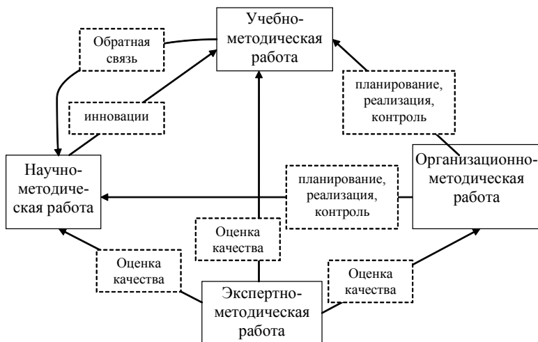
Рис. 1. Обобщенная схема взаимосвязи направлений методической работы кафедры

Решение задач, которые обеспечивают достижение основной цели методической работы, осуществляется в формах: учебно-методической работы, научно-методической работы, организационно-методической работы и экспертно-методической работы. Все эти формы не имеют жесткого разграничения и являются взаимосвязанными. Обобщенная схема взаимосвязи направлений методической работы кафедры изображены на рис. 1.