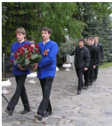
8 мая — митинг Памяти. Возложение цветов и гирлянды

О мантиях разговор особый. Это тоже не декорация и не карнавальный костюм. С античных времен мантия — это парадное облачение ученых