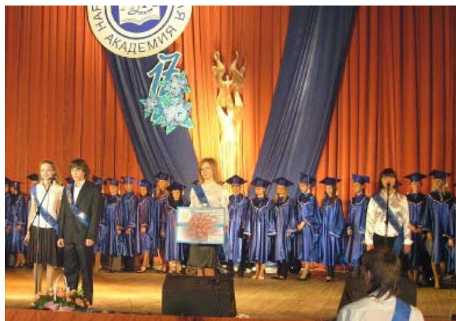
29 мая — День рождения Академии. На сцене магистры и выпускники СЭПШ

Знамя является официальным символом НУА, сертифицированным ровно десять лет назад 28 июля 1997 года (государственный патент № 1910) и свидетельствующим о самостоятельности и самодостаточности академии, о высоком уровне ее организационной и корпоративной культуры. Знамя прикреплено к стандартному древку, которое заканчивается вверху наконечником из белого металла, украшенным логотипом НУА. Хранится наше знамя в музее истории академии, выносятся один