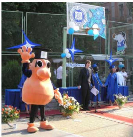
Символ академии НУАшка.

Большое внимание в экспозиции музея уделяется воспитательной работе. Здесь отражаются как традиционные для студенческой и школьной жизни дела, так и присущие только нашей академии события. Посетители с интересом знакомятся со многими традициями, сложившимися в академии — от праздника первого звонка до выпускного вечера. Стенды и видеоматериалы воссоздают праздничное настроение, сопровождающее традиционные академические мероприятия: День рождения академии, Новогодний карнавал, Дни рождения библиотеки, музея, академической газеты, а также КВН первых курсов, Экватор третьего курса, конкурс ораторского искусства и многие другие. Особенно кропотливо и тщательно проходит подготовка всех «академиков» к основному, уже ставшему традиционным, конкурсу «История моей семьи». Конкурс проводится по нескольким номинациям: «Забытая фотография», «Великая Отечественная война в истории моей семьи», «Служение Отечеству и долгу в моей семье», «История любви в истории моей семьи», «Учитель в моей семье», «Традиции и реликвии в моей семье». В процессе многочисленных встреч, работы с документами, домашними архивами, воспоминаниями участники