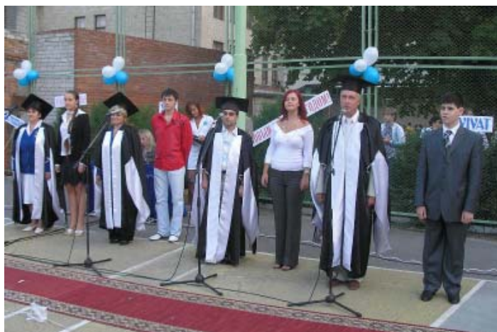
Посвящение в студенты.

Как отмечает известный российский историк Н. М. Карамзин, славяне всегда обожествляли свои знамена и считали, что в военное время они святее всех икон и оберегов. Сбить знамя противника – означало победу в битве. Не случайно символом поражения Германии в Великой Отечественной войне стало сбрасывание фашистских знамен к подножию Мавзолея на Красной площади в Москве. Идея святости знамени, его священности активно возрождается в наши дни.