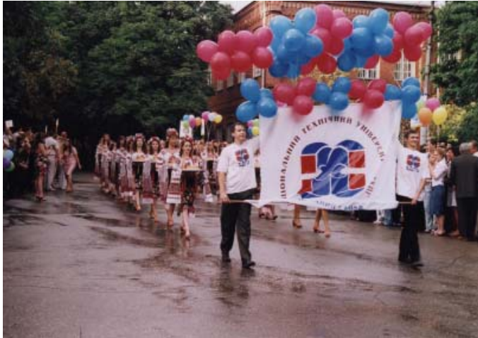
На святі Посвячення у студенти НТУ «ХПІ»

Невід’ємною частиною навчально-виховної роботи в університеті, до якої, звичайно, належить і робота музею історії університету, стало залучення студентів до традицій, які склалися протягом десятиліть. Одна з них – свято «Посвячення в студенти НТУ «ХПІ», яке проводиться щорічно 1 вересня. Першокурсники беруть участь у параді факультетів, під час якого знайомляться зі своєю групою, деканом, керівництвом університету. Кожний факультет вишукується під своїми емблемами. Кульмінацією свята стає запалювання ректором університету символічного Вогню знань та передавання Ключа знань студентам-першокурсникам від випускників. Так з самого початку навчання вони відчують, що приєднуються до великої і дружньої сім’ї політехників.