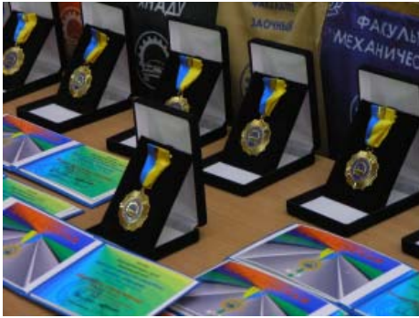
Почесний знак ХНАДУ «За видатні заслуги»

До ювілейних дат виготовляється та видається святкова атрибутика: почесні знаки, збірки, збірники, буклети, проспекти, фотоальбоми, кейси, значки, вимпели, прапорці, ручки, годинники, футболки тощо – із символікою ХНАДУ, що також сприяє патріотичному вихованню молоді.