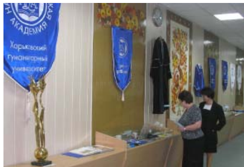
Тематическая выставка «Традиции и символика Народной украинской академии»

К традиционным реликвиям, которые есть у каждого вуза, мы