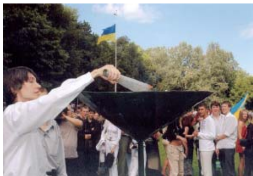
Зажигается «Огонь знаний»

Две змеи в ветеринарной эмблеме символизируют единое начало медицины и ветеринарной медицины, в равной мере несущих ответственность за здоровье человека. Ведь врачевание больных людей и животных развивалось параллельным путем и на протяжении большого исторического периода профессионально не разграничивалось. И как тут не вспомнить высказывание