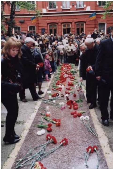
Біля меморіалу пам'яті на території НТУ «ХПІ»

Важливим напрямком роботи музею є патріотичне виховання молоді. Майже 40 років ведеться робота з увічнення пам'яті викладачів, аспірантів та студентів, загиблих у роки Великої Вітчизняної війни. За роки