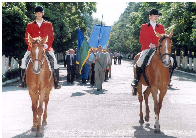
Торжественное открытие праздника «День знаний».

Накопленный за многие десятилетия ценный исторический материал составил основу экспозиции музея истории. Коллекция