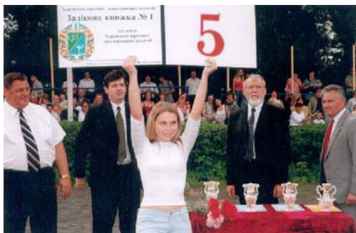
Учиться только на «5» — напутствие первокурсникам

Зеленый цвет на щите герба, на фоне которого расположены символы генетики, означает надежду, достаток, свободу, радость и соответствует зооинженерии. На голубом фоне расположено серебряное символическое изображение факультета ветеринарной медицины.