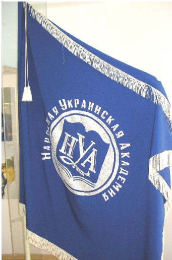
Знамя ХГУ «НУА»

Академия вступила в восемнадцатый год своей истории. 18 лет — это, конечно, еще очень юный возраст, но к этому времени у человека уже успевают обычно выработаться характер и привычки, жизненные ценности и позиции, идеалы и принципы. Академия создавалась людьми и для людей, и в свои 18 лет она уже успела выработать достаточно твердые принципы и позиции, заняла свое достойное место в системе образования Украины, сформировала свою символику, свои традиции, правила корпоративной культуры. Их много, и они, как всякий живой организм, подвижны и изменчивы, но есть среди них такие, которые определяют глубинную сущность академии, ее непохожесть на других, ее прошлое, настоящее и будущее. Не случайно древние греки говорили: истина является в мир в форме символов и традиций (Гораций).