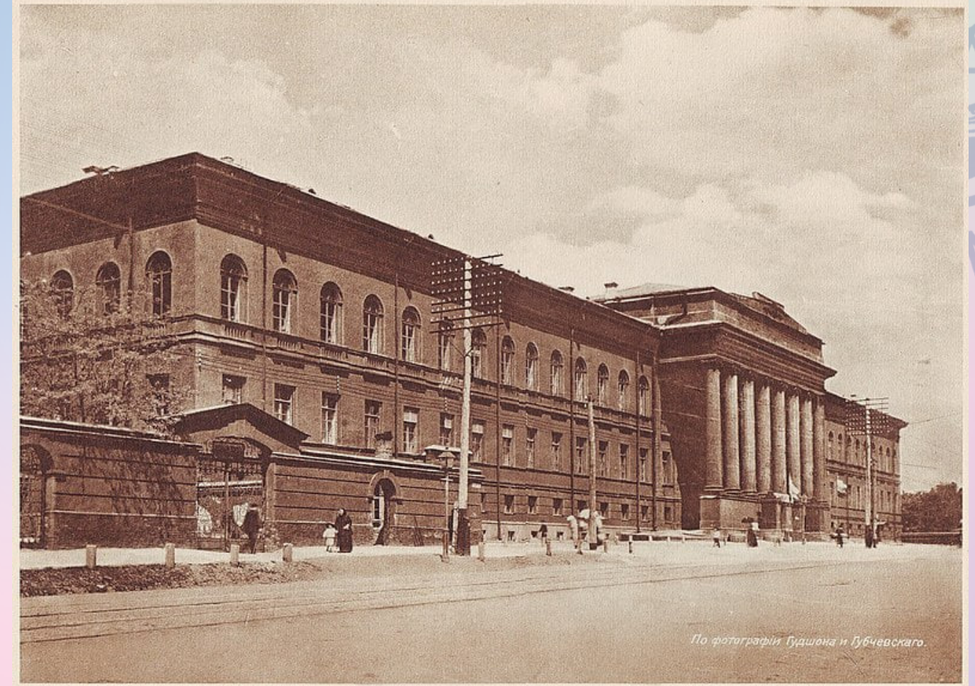
Императорскій Университетъ Св.Владимира.

→ Харківський національний університет імені В.Н. Каразіна