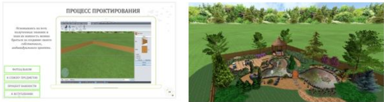
Рис. 1. Початковий і завершальний фрагменти мультимедійного проекту

Метод організації своїх знань за допомогою моделювання дуже ефективний в навчанні, адже в момент вивчення і отримання нової інформації з'являється можливість її правильної організації і постанови взаємозв'язку з певними дисциплінами.