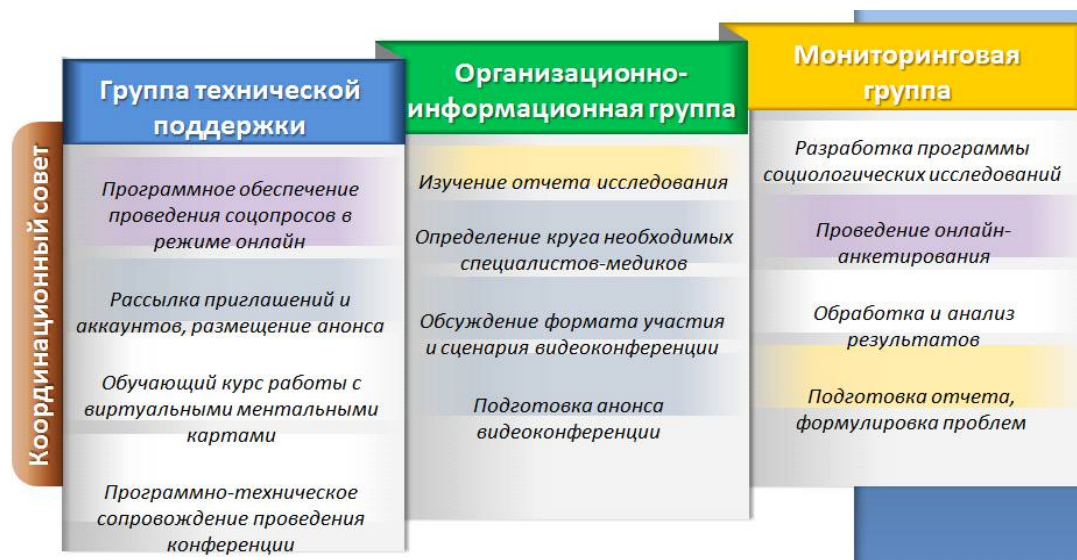
Рис. 1. Реализация концентрированной модели сетевого партнерства институтов образования, семьи и здравоохранения

В рамках первого направления нами разработана модель концентрированной сети, где управление взаимодействием осуществляется координационным советом, в состав которого входят представители разных институций. Координирующим органом создаются целевые группы с четко определенными функциями: мониторинговая, организационно-информационная, группа технической поддержки (см. рис. 1). В их состав могут входить представители всех субъектов-партнеров или отдельные физические лица, в зависимости от специфики их основной деятельности. Так, в состав мониторинговой группы целесообразным является введение специалистов Института охраны здоровья детей и