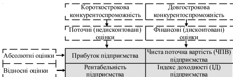
Рис. 1 1. Вартісні показники, які пропонується застосовувати для оцінки рівня КС підприємств у короткостроковому та довгостроковому періодах

ності) роботи підприємства, як рентабельність. Тоді чинниками моделі можуть бути стандартні показники ефективності фінансово-господарської діяльності підприємства, що традиційно розглядаються при оцінці в якості чинників КС.